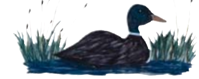
Ein kanadisches Naturerlebnis ...