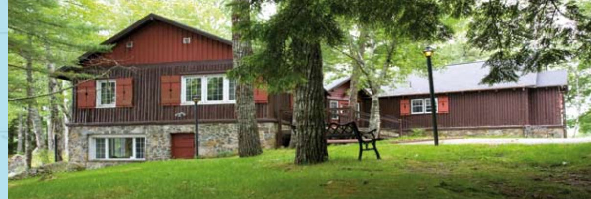
Ideal für Tagesausflüge und Besichtigungstouren